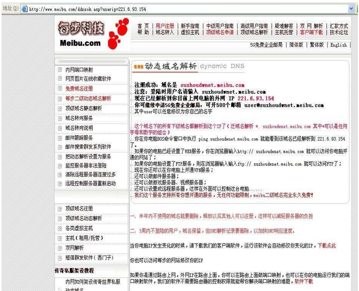
图 5. 返回页面