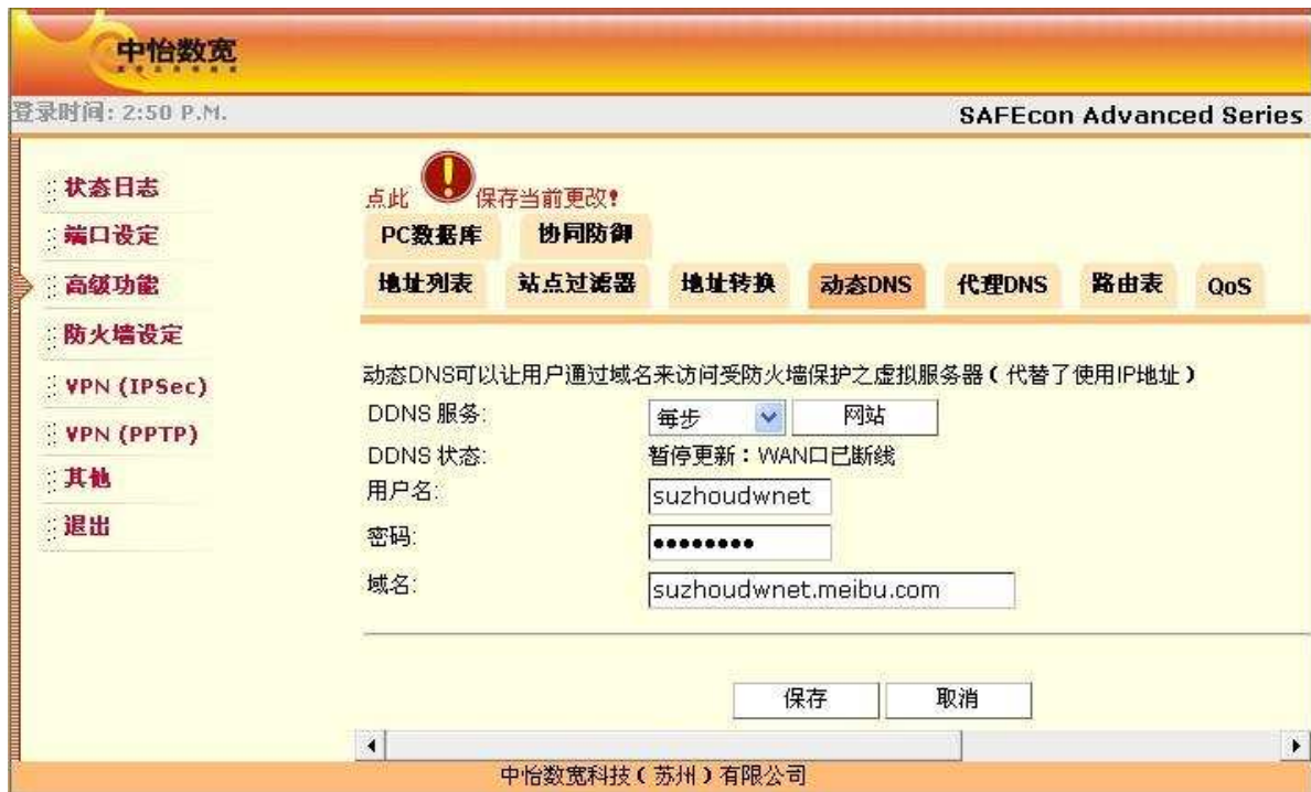
图 9. DDNS 状态 1

请检查您网络的物理线路有没有出现问题：例如猫的线有没有接好，设备的 wan 口线是不是掉了等。