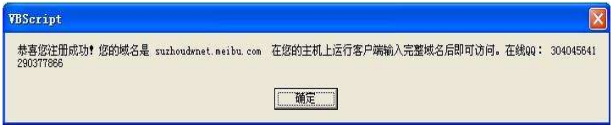
图 4. 域名注册成功

输入您想申请的域名，密码，Email,这些都输入好以后，单击“提交”按钮。IE 浏览器会弹跳出域名注册成功的提示：