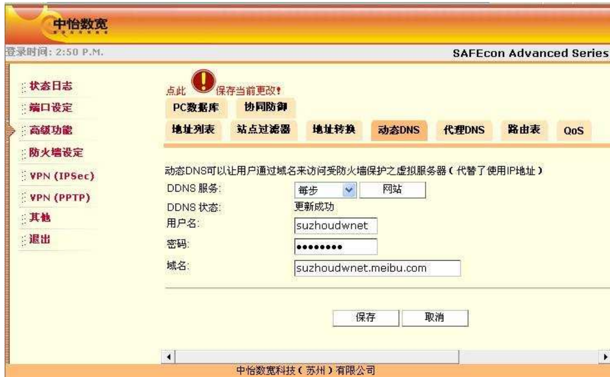
图 6. 动态 DNS 页面