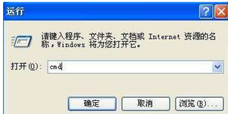
图 7. 运行界面