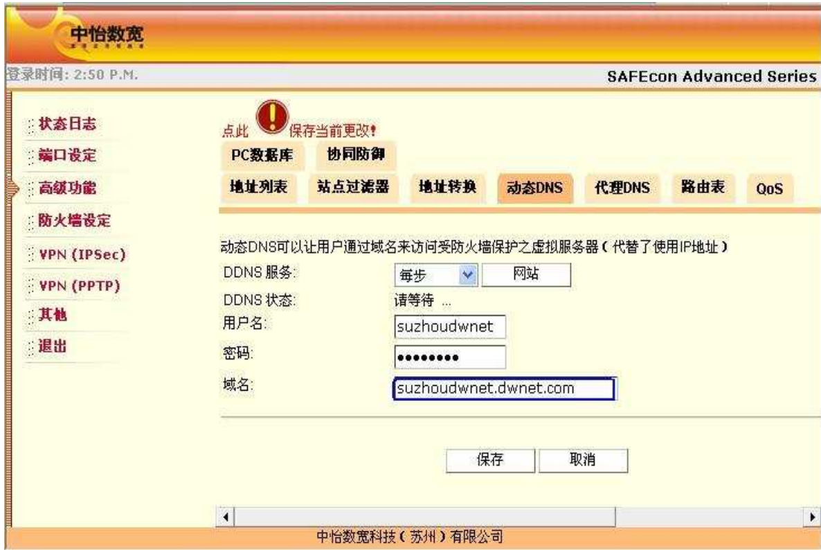
图 11.DDNS 状态 3

首先请检查您的域名是否输入正确，如上图中错把域名写为 suzhoudwnet.dwnet.com。每步没有提供类似于 dwnet.com 为后缀的域名。如果域名正确，请检查您防火墙的上层网络是否封闭了 UDP 的端口。